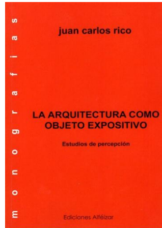
LA ARQUITECTURA COMO OBJETO EXPOSITIVO